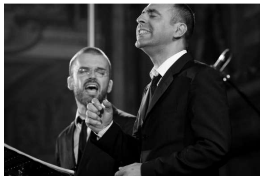
Sete Lágrimas

Pražské Letní slavnosti staré hudby jsou festivalem souborů hrajících na autentické dobové nástroje. Letošní 15. ročník se pod heslem Slasti a milosti soustředuje na hudbu doby osvětenství 17. a 18. století. Jednak na díla světského typu, která vzešla z lidové hudby, jednak na uměřenější elegantní salónní hudební projev. Obě formy prezentovaly dva zahraniční soubory hrající před plnými sály v pondělí (Trojský zámek) a ve středu (kostel sv. Šimona a Judy).