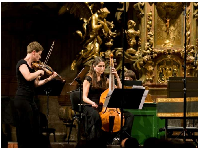
Orkiestra Historyczna