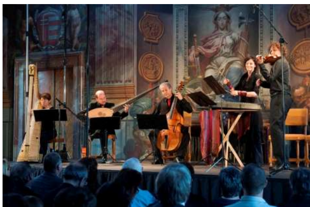
Echo du Danube

Když se tak probírám čtrnácti uplynulými ročníky, skoro v každém se dá najít malý skvost, třeba hned na začátku to byla barokní hudba a francouzské tance ve Vrtbovské zahradě s úžasnou atmosférou. Zajímavé byly i scénické rekonstrukce francouzských barokních baletů a došlo i na Molièra, jehož Scapinova šibalství festival uvedl v duchu barokního divadla s osvětlením svíčkami, dobovým líčením jako hereckou a pohybovou improvizaci. Anebo další francouzský soubor Compagnie de l'Eventail z Francie, s kterým jsme se před čtyřmi lety mohli protančit barokní Evropou: nová choreografie na hudbu starých mistrů vynalézavě zúročila původní krokové variace.