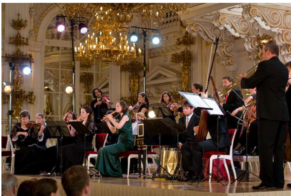
Collegium Marianum