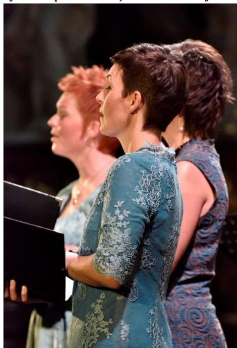
Trio Mediaeval