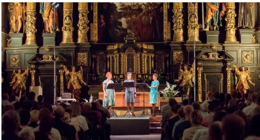
Trio Mediæval