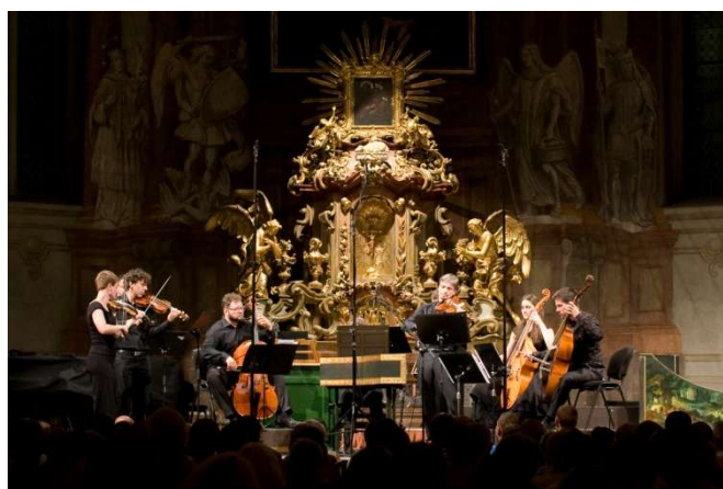
Orkiestra Historyczna

Koncert s poetickým názvem Od krčmy k oltáři byl u příležitosti Roku české hudby věnován dílu významné osobnosti barokní hudby, kterou byl houslista a hudební skladatel Heinrich Ignaz Franz von Biber, jenž pocházel ze Stráže pod Ralskem a nějaký čas působil v kapele kroměřížského biskupa Karla II. z Liechtensteinu-Castelcornu. V pražském kostele sv. Šimona a Judy provedl polský soubor {oh!} Orkiestra Historyczna kompletní Biberovu sbírku dvanácti Sonatae tam aris quam aulis servientes, které byly určeny jak k provedení v chrámu, tak i u dvora.