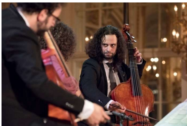
Accademia del Piacere