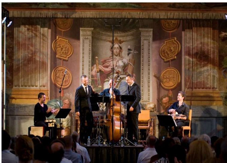
Sete Lágrimas

Většina skladeb byla v portugalštině, avšak některé texty byly též ve španělštině, aztéčtině, africkém nářečí a dalších jazycích amerických indiánů. Téměř všechny vybrané kompozice totiž byly duchovního charakteru a sloužily ke christianizaci místních obyvatel, tudíž se v řadě z nich náboženská témata oděla do hávu jazyka i hudebního stylu zdejší kultury. Všechny tyto styly se pak v rámci rozsáhlých koloniálních říší Portugalska a Španělska vzájemně ovlivňovaly a mísily. I když by se mohlo zdát, že dva shodné typy hlasů, byť odlišné barevně, budou působit monotónně, vzájemná perfektní komunikace i bohatost aranží byly takové, že se interpreti tomuto nebezpečí dalece vyhnuli. Svůj díl na tom mělo též