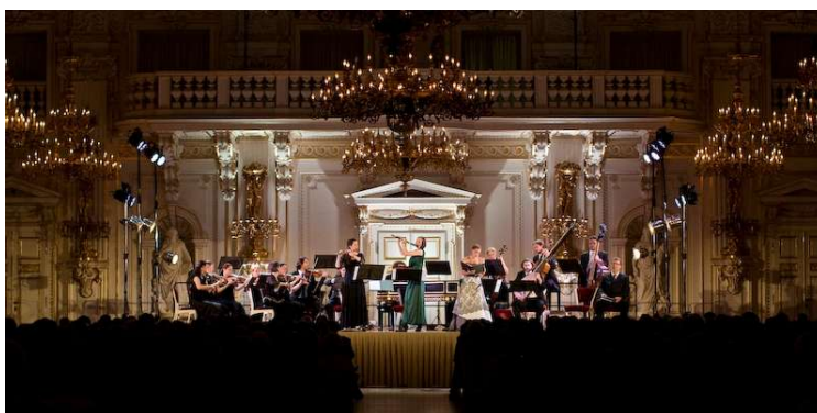
Collegium Marianum